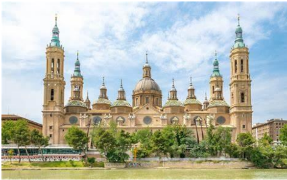
Basílica de la Virgen del Pilar. Zaragoza (España)

La Virgen del Pilar es de gran importancia para todo marianista. En 1797 el P. Guillermo José Chaminade fue expulsado de Francia; se refugió en España. La víspera de la fiesta del Pilar llegó a Zaragoza, donde permaneció hasta su regreso a Francia. A los pies de la Virgen del Pilar tomó cuerpo el proyecto misionero que fue aplicando cuando volvió a Burdeos, el 1800.