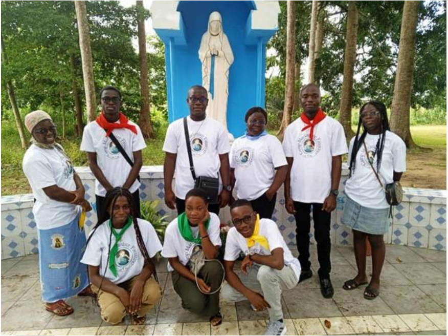
Miembros del "Club Faustino" en uno de los encuentros