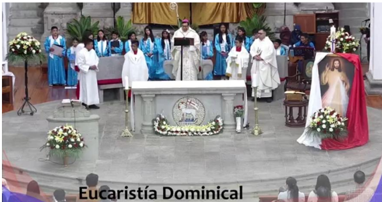
Eucaristía Dominical En la catedral de San José Latacunga (Ecuador).