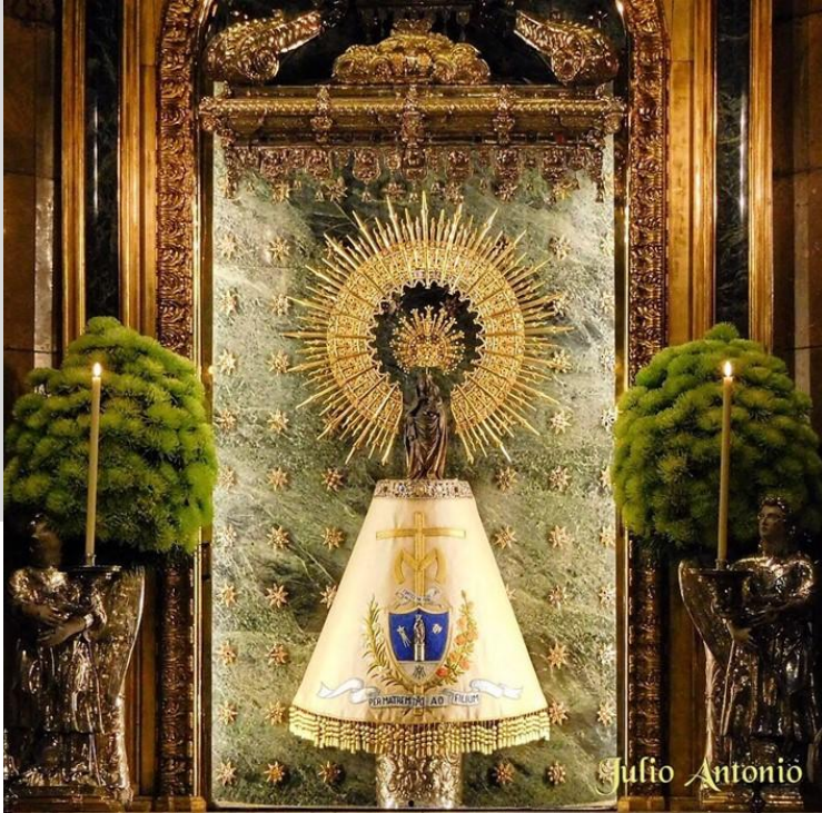
Imagen de Nuestra Señora del Pilar con el manto Marianista