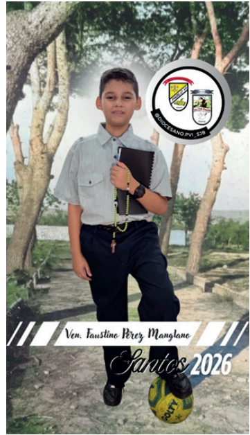
Portada del vídeo

Estamos muy felices de colaborar en la difusión de la vida de este "gigante de la alegría".